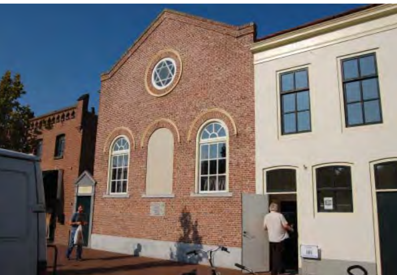
De Sjoel in Brielle

We kennen natuurlijk allemaal het Den Briel van de watergeuzen (ook niet allemaal lieverdjes) en de wrede Alva, die daar zijn 'bril' verloor. Ik ken het van een schoolreisje in verband met het afscheid van de lagere school in 1960. Wij verbleven toen in een jeugdherberg en voor mij was het toen de eerste echte 'vakantie'. En nu dan terug in Den Briel voor een 'Heijstekendag'.