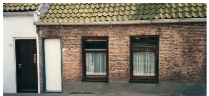
Het huisje van Pieter en Maria Heijstek. zoals het in 1988 in Colijnsplaat stond aan de Ringweg nummer 30.