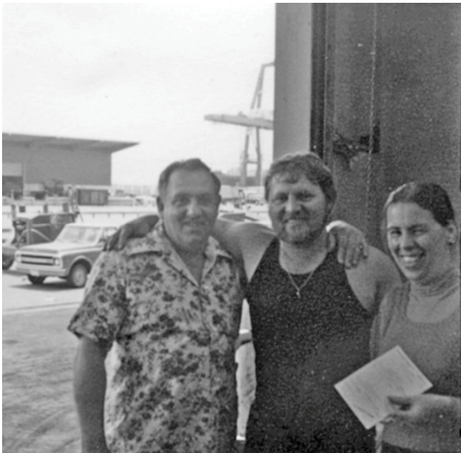
Boven: De scooter is eindelijk ingeklaard. Onder: Harpers Ferry.