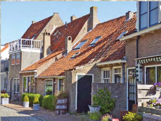
Brielle anno 2011.

Op het oudste plein van de stad proeft men bij de stadspomp uit 1590 de sfeer van toen. Genieten van een aangename stilte doet men bij het Asyl voor Oude en Gebrekkige Zeelieden. Aan het Maarland met vele monumentale panden kan men getuige zijn van de bedrijvigheid van de haven. Van de stadspoort die de watergeuzen met hun scheepsmast inbeukten zijn helaas enkele schamele resten over. De overige vestingwerken zijn nog helemaal intact en maken veel Brielse historie tastbaar. Bastions, ravelijnen, 'beren' met 'monniken', twee poorten, het Kruithuis en een brede gracht vormen de unieke vesting. In de gevels van veel huizen zijn, soms zeer oude, gevelstenen op te merken.