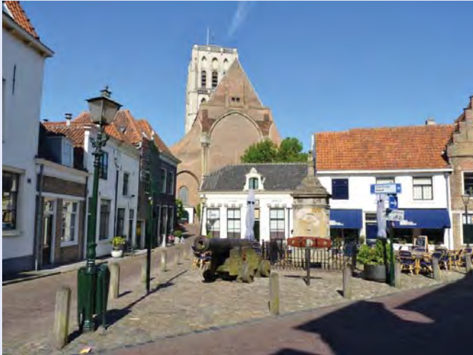
Oudste plein van Brielle, op de achtergrond Sint-Catharijnekerk.

Brielle is in de twintigste eeuw buiten zijn oude krijgskundige grenzen getreden. Verschillende nieuwbouwwijken schurken tegen de oude vestingstad aan. Gelukkig is de stad nauwelijks aangetast en door tal van restauraties alleen maar mooier geworden. De vestingwerken vormen in feite het meest omvangrijke Brielse monument. De stille groene omwalling is een florarijck wandelpark. In de beschutting erachter liggen 420 monumenten, gereed om ontdekt te worden. Middelpunt van deze aangename ontdekkingsreis is de Sint Catharijnekerk: een laatgotisch gebouw dat de stad en de landen van Voorne domineert. De kerk uit 1417 is imposant, maar had nog veel indrukwekkender moeten worden.