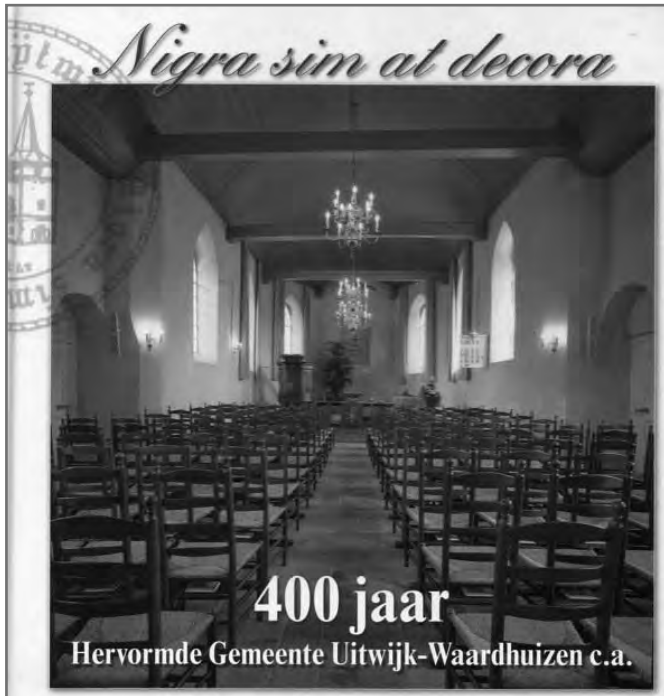
Nigra sim at decora , 400 jaar Hervormde Gemeente Uitwijk-Waadhuizen c.a. ISBN 978-90-9022268-4.

In het jaar 2007 verscheen er een boek ( Nigra sim at decora ) over 400 jaar Hervormde Gemeente Uitwijk-Waadhuizen c.a. Dit zeer lezenswaardig boek bevat veel geschiedenis van het kerkelijk leven in Uitwijk de plaats waar onze voorouders vandaan komen. Het is dan ook niet verbazend dat de naam Heijstek in dit boek verschillende keren voorkomt. Het lijkt ons leuk u enkele zaken uit dit boek door te geven.