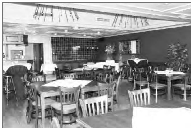
Een deel van de zaal in hotel café restaurant De Koppelpaarden in Dussen, die voor de familiedag is gereserveerd.

En natuurlijk ging Cees - zoals het een echte Heijstek betaamt - poolshoogte nemen en de locatie verkennen en waar nodig beoordelen of die voor onze familie voldoende stijl heeft om daar te verblijven. Kortom hij ging