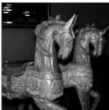
Ook de kunstobjecten kregen een kritische beschouwing en die werden na een korte tijd in orde bevonden.