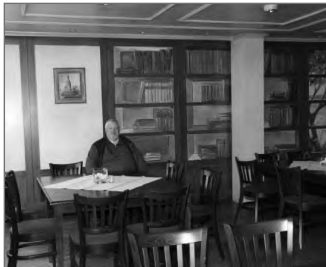
De stoelen in de zaal worden getest en goedbevonden.

op inspectie. De buitenkant en het onderhoud aan de binnenkant ziet er allemaal goed uit. De stoelen zitten goed en de tafels hebben een goede en aangename hoogte.