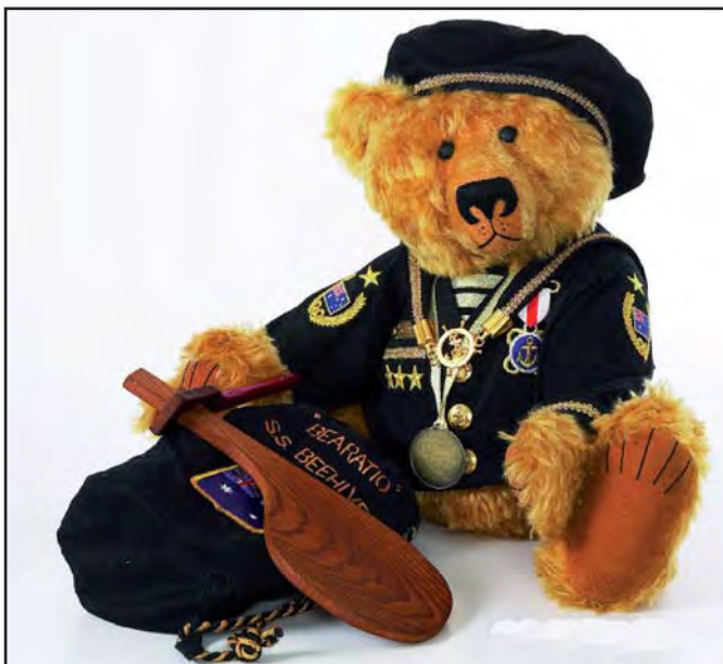
Bearatio is ook een prijswinnaar.

Andere winnende beren zijn Bluey , een 46 cm grote matroos met de Australische vlag op zijn neus geborduurd. "Hoewel ik in Nederland ben geboren ben ik een zeer trotse Australische", verduidelijkt Barbara. Dan is er Bearatio , een andere zeeman, Brave Bear en Bucky , een stoere indiaan met zijn stokpaardje en Bustah de clown