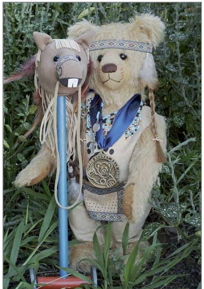
Indian Brave met zijn stokpaardje.