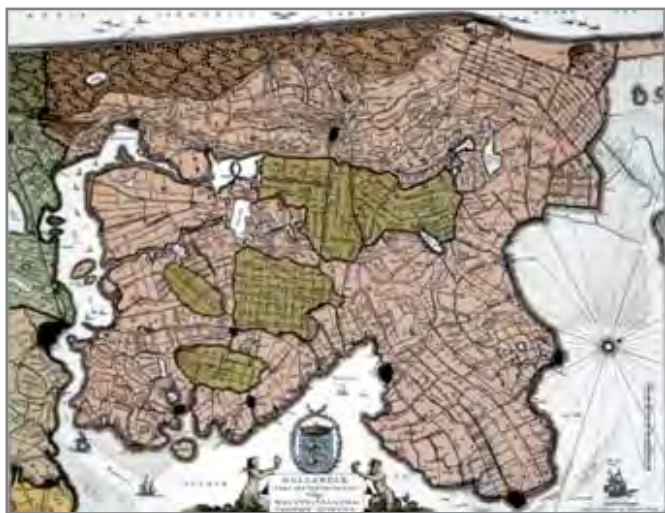
De droogmakerijen Starnmeer, Beemster en Schermer.

Ook voor het Alkmaarder- en Uitgeestermeer bestonden inpolderingsplannen, maar door dalende grond- en landbouwprijzen zijn die nooit uitgevoerd. Het hoogteverschil tussen de diepe droogmakerijen en de omliggende oude veenpolders is duidelijk zichtbaar. De Beemster is in 1999 door Unesco op de Werelderfgoedlijst geplaatst vanwege de unieke onstaansgeschiedenis