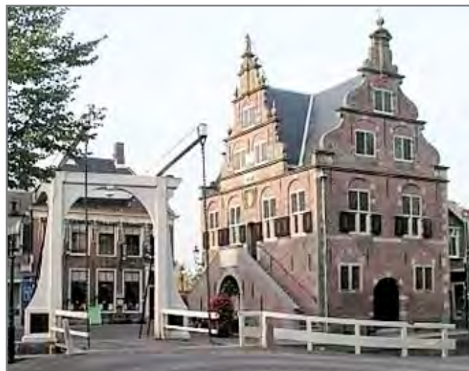
Het raadhuis van De Rijk

en strakke landschapsplanning, die nog goed herkenbaar is. De tocht is 44 km lang, maar 'onze' Piet zal die in het voorjaar eerst verkennen. Misschien dat hij hem inkort zodat er meer tijd overblijft om het dorp De Rijk te bekijken.