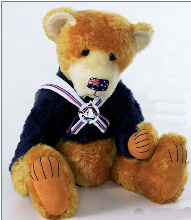
Bluey met de Australische vlag op zijn neus geborduurd.

ders doen, dus gingen we op zoek naar accessoires. Graham en ik gingen naar de Harley Davidson-winkel in Homebush om logo's te kopen en ik gebruikte het leer van mijn lange zwarte rok om Billy's vest en pet te maken." Billy is 56 cm hoog en is gemaakt van Engels mohair, terwijl Beeper 18 cm hoog is en is gemaakt van Schulte crew pile mohair , en beiden zitten in een karretje gemaakt door Graham met " Harley Dreaming " op de achterkant geschilderd.