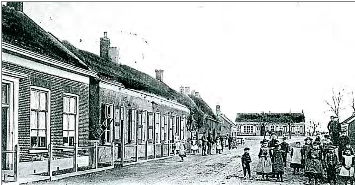
Dorpsgezicht op Geersdijk.