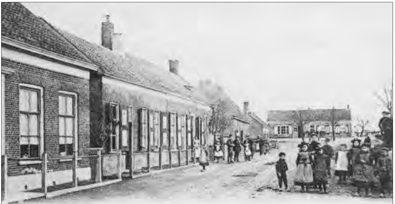
Dorpsgezicht van Geersdijk omstreeks 1905.

Het was de tijd dat de slootjes, de zogenaamde reedulfjes, werden dichtgegooid en de akkers gedraïneerd. Zodra de buizen gelegd waren, werden de dulfjes volgereden. De bodem was goed want er had nooit iets anders opgegroeid dan gras. Het was allemaal weilandhumus. De aardappelen, die meestal het eerste jaar werden verbouwd, deden het er best, behalve als je nat weer had, want dan kwam er nogal wat rot in. Sproeien was nog onbekend. Zodra de aardappelziekte zich vertoonde, waren de mensen angstig, want men wist nog hoe in 1845 de aardappelen in één nacht zwart geworden waren. Dat was hen bijgebleven. Hiertegen geen middel hebben was