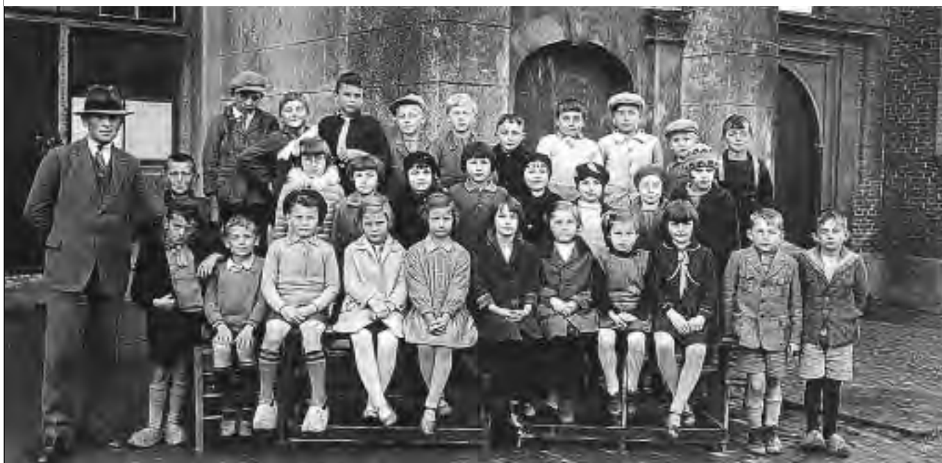
Foto ontleend aan "Colijnsplaat in vroeger tijden" deel 1 samengesteld door Gerard de Fouw.