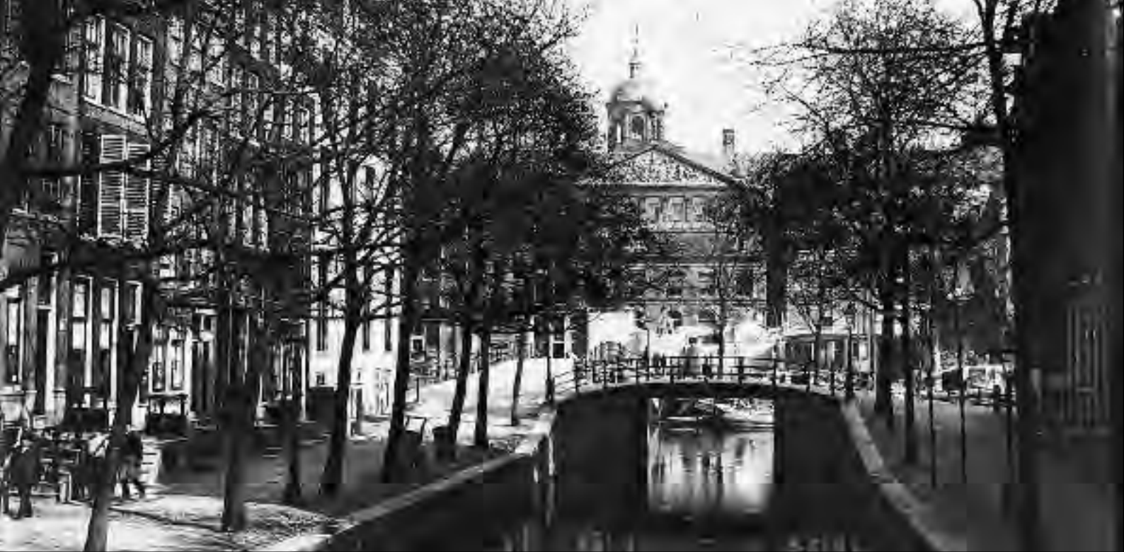
Het huis van Antonie Lodewijk Heijstek, Warmoesgracht 5. Na 1895 werd het de Raadhuisstraat. Gezien naar de Singel en gedeeltelijk het Koninklijk Paleis.

Het huis tegenover de handkar had bij de straatnummering van 1805 het kleine nummer 5